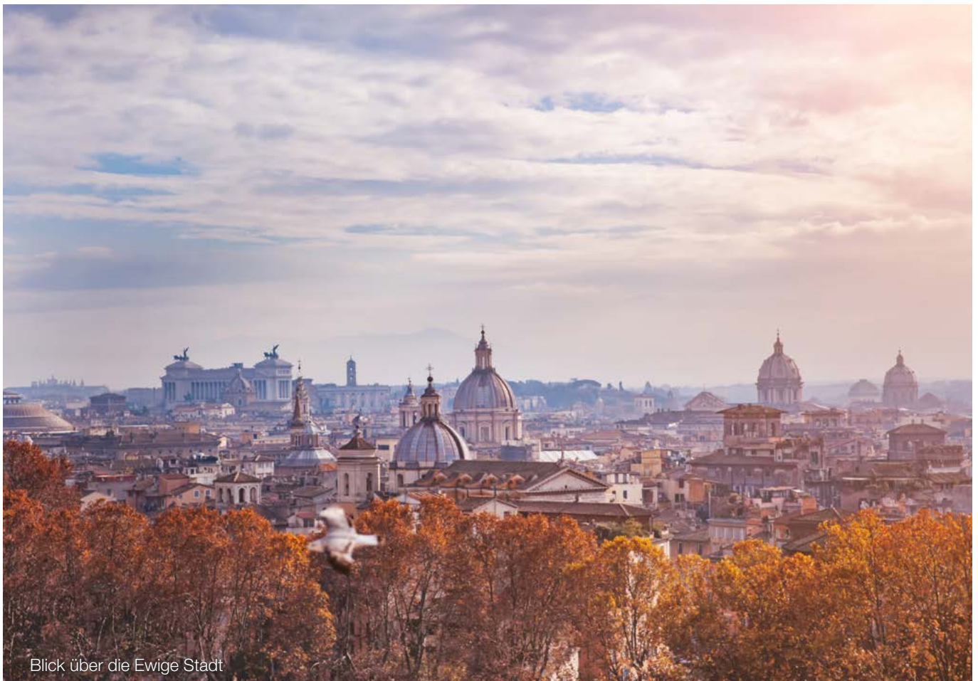
Blick über die Ewige Stadt

Gem. RefE wird die Mindeststeuer im Mindeststeuergesetz (MinStG) als eigenständige Steuer implementiert. Dadurch soll sichergestellt werden, dass die konsoli-