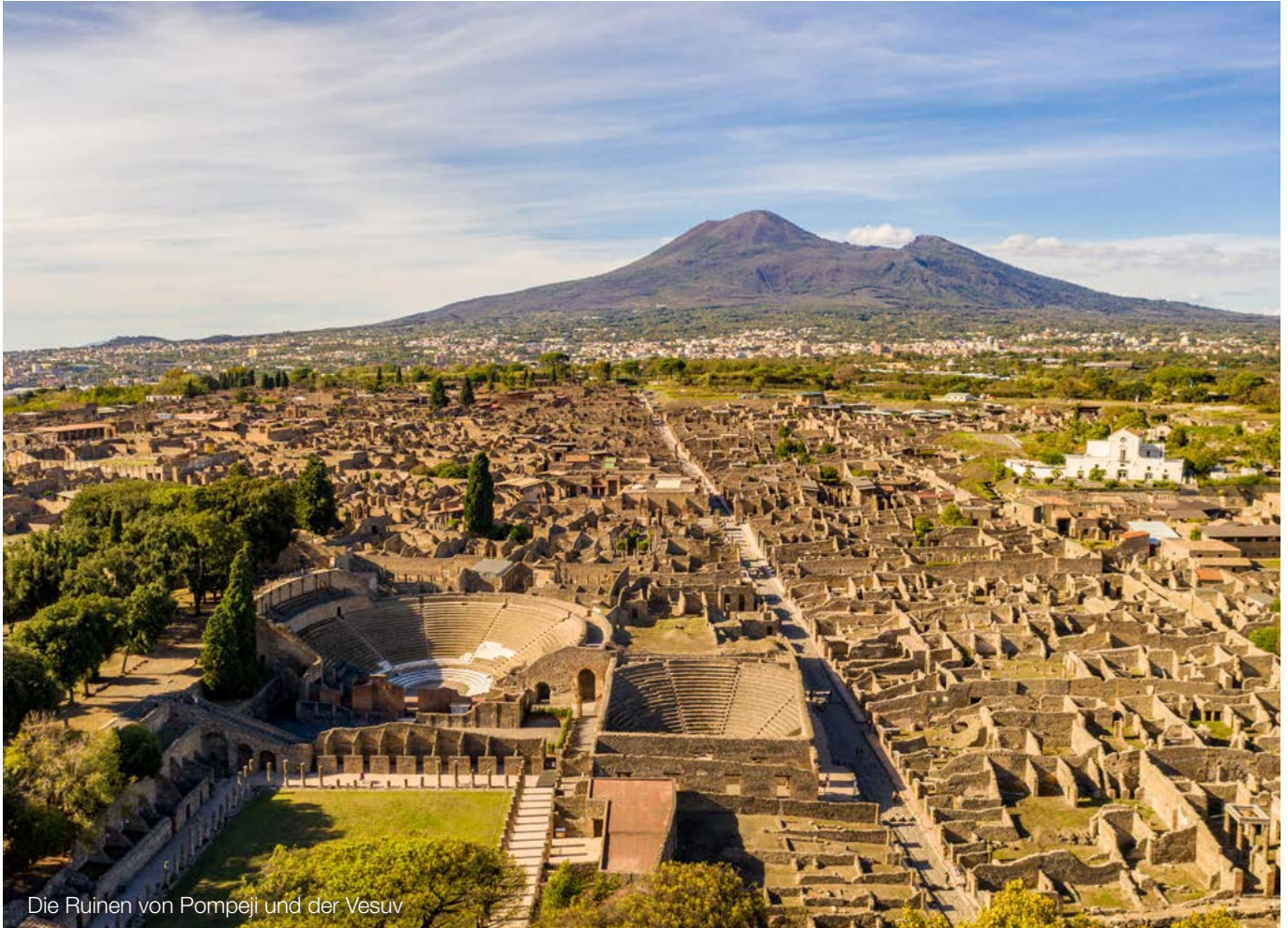
Die Ruinen von Pompeii und der Vesuv

Pauschale Risikoprämien auf den Kapitalisierungszinssatz werden seitens des IDW und auch seitens weiterer führender Stimmen in der Bewertungspraxis abgelehnt. Vielmehr seien die Risiken in der Planung und ggf. spezifischen Risikoszenarien zu berücksichtigen. Eine durch die Krise veränderte Verschuldungssituation des Unternehmens werde bei der Ermittlung des Kapitalisierungszinssatzes