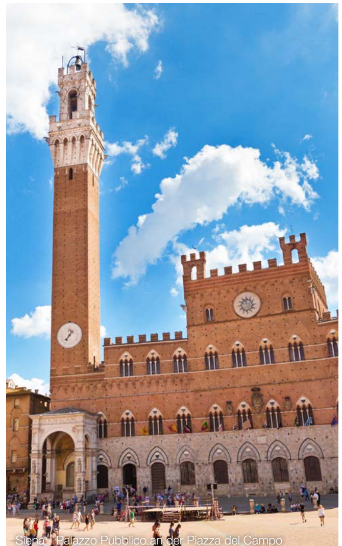
Siena Palazzo Pubblico an der Piazza del Campo

Hintergrund: Entsteht ein „Verlust“ i.S. des § 17 EStG im Zuge einer Anteilsrotation aufgrund eines Kaufpreises, der den echten Wert des veräußerten GmbH-Anteils widerspiegelt, dann ist dieser Verlust auch für steuerliche Zwecke zu berücksichtigen. Grundsätzlich liegt bei einer Anteilsrotation ein Gestaltungsmissbrauch i.S. des § 42 AO nicht vor, da es dem Gesellschafter freisteht, ob, wann und an wen er seine Anteile veräußert. Das gilt zwar auch dann, wenn die Veräußerung zu einem Verlust führt, nicht aber bei signifikanter Verfehlung der realen Wertverhältnisse.