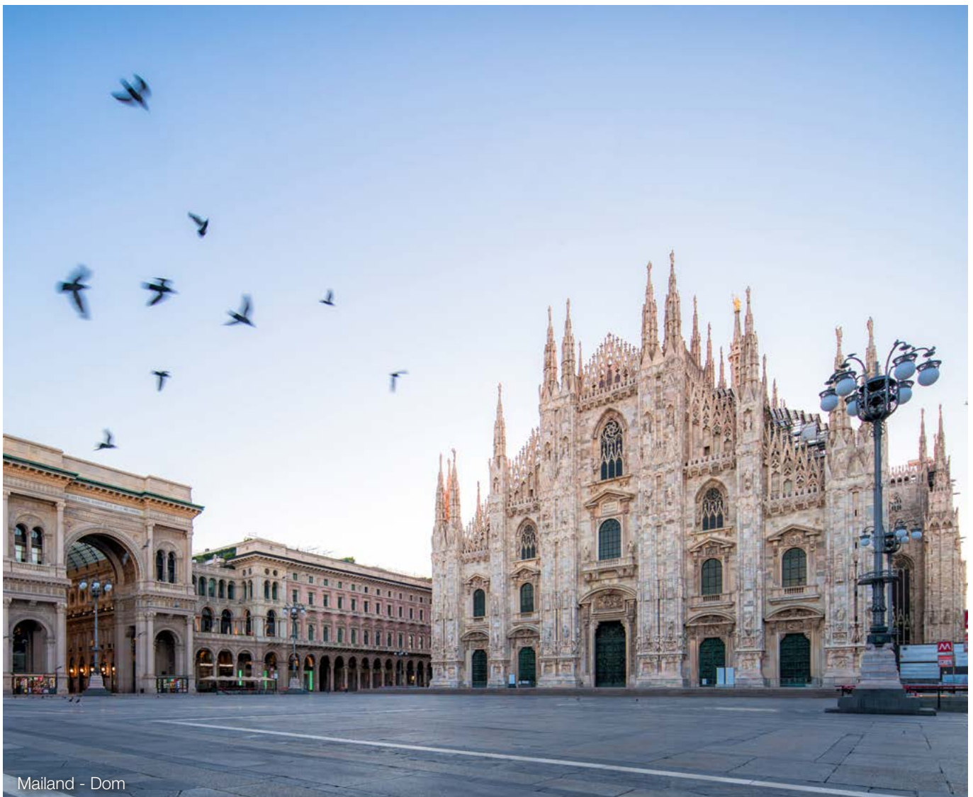
Mailand - Dom

Betroffen sind Unternehmer, die in Deutschland ansässig sind (Sitz der Geschäftsleistung oder inländische Betriebsstätten, die am Umsatz beteiligt sind) und die an ebenfalls