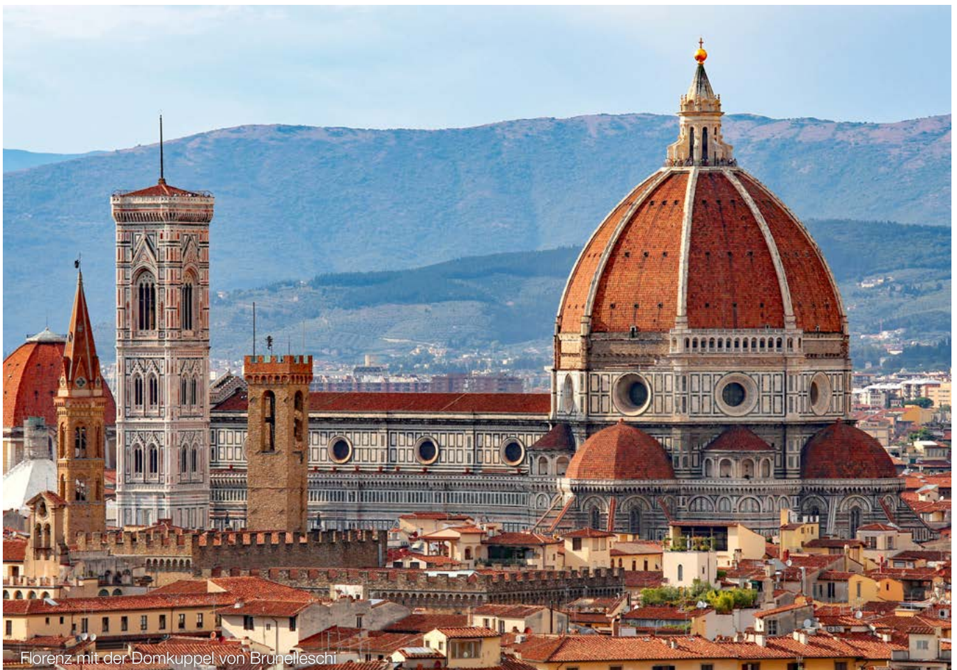
Florenz mit der Domkuppel von Brunelleschi

Nach dem MoPeG wird die Gewinnverteilung neu geregelt: An die Stelle des Vorabgewinns und der Verteilung des Restgewinns nach Köpfen tritt eine Gewinnverteilung nach den vereinbarten Beteiligungsverhältnissen, im Zweifel nach dem Verhältnis der vereinbarten Werte der Beiträge. Nur wenn auch für die Beiträge gem. § 713 BGB n.F. keine Werte vereinbart wurden, bleibt es bei der Verteilung nach Köpfen.