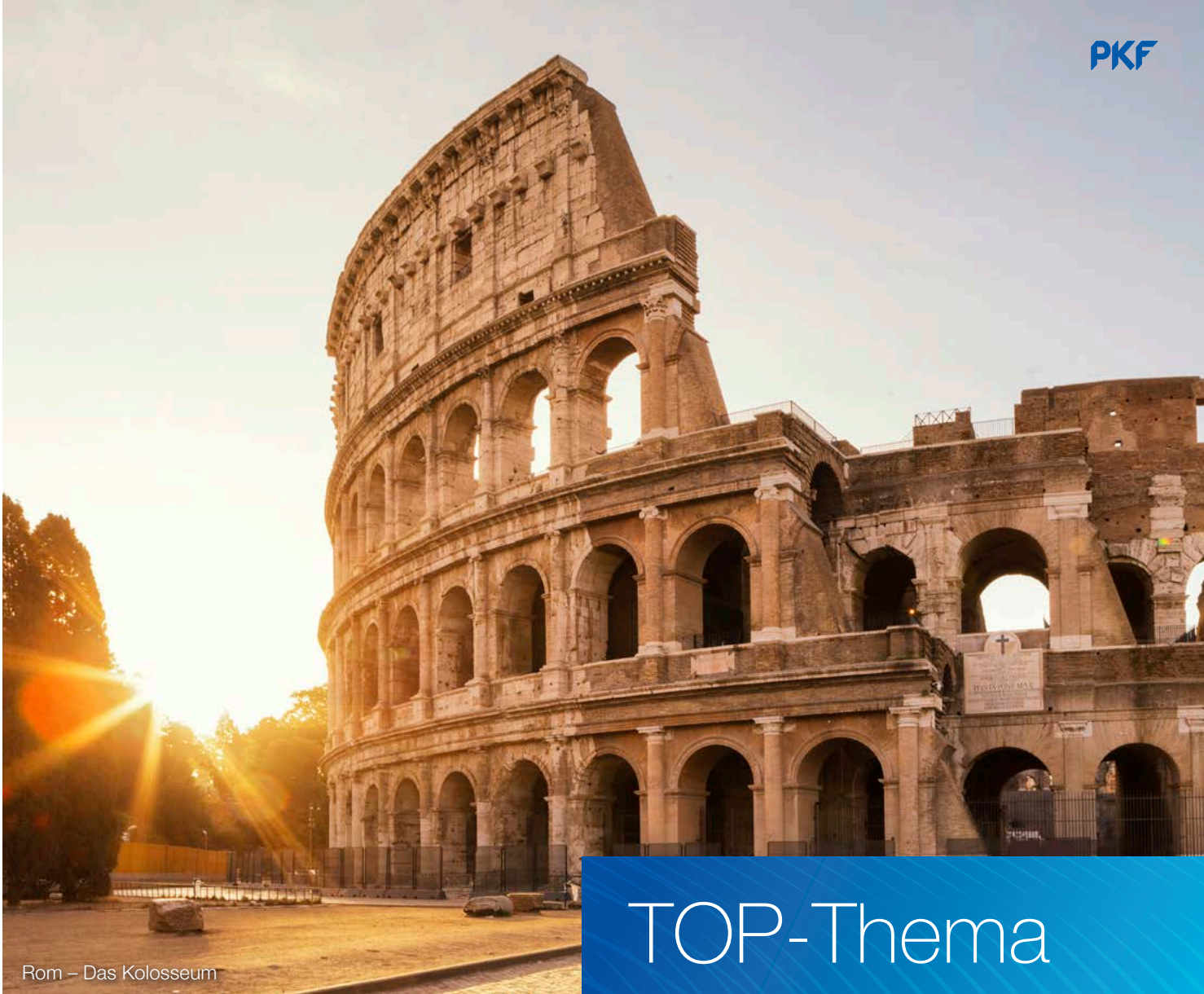
Rom – Das Kolosseum