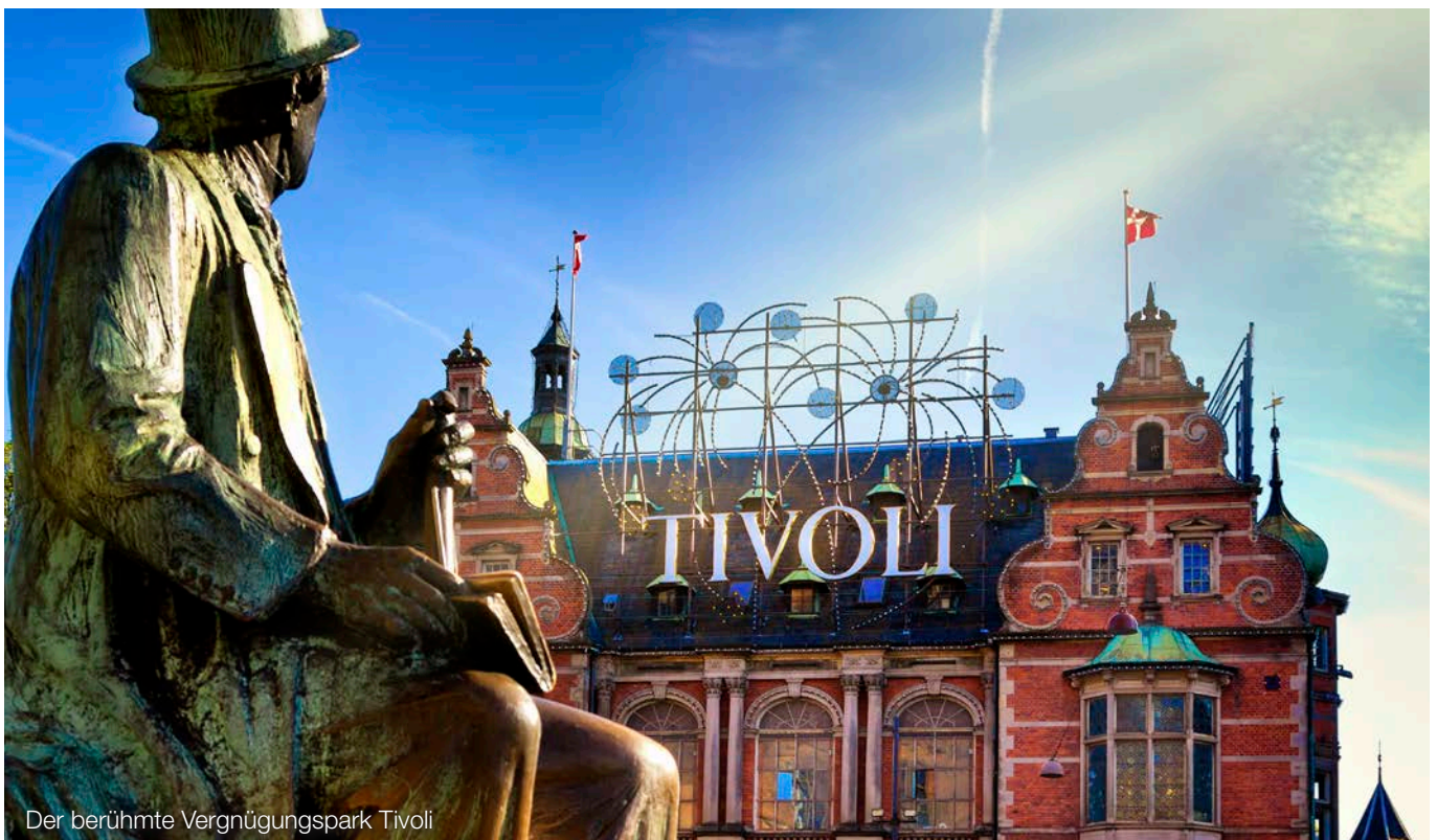
Der berühmte Vergnügungspark Tivoli

Besteht eine Organschaft, schuldet der Organträger die Umsatzsteuer für die Umsätze der Organgesellschaft. Zudem unterliegen zumindest nach der bisherigen deutschen Gesetzeslage die Entgelte, die im Rahmen eines Leistungsaustausches zwischen den Mitgliedern der Organschaft gezahlt werden, nicht der Umsatzsteuer; diese Mitglieder werden als Teile eines einheitlichen Unternehmens angesehen.