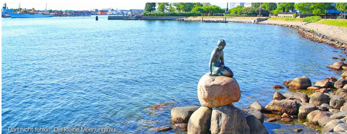
Darf nicht fehlen: Die kleine Meerjungfrau

Ergebnis: Diese Voraussetzung ist hier gegeben, da die betreffende Dienstleistung ausschließlich an Endverbraucher erbracht wurde, die nicht zum Vorsteuerabzug berechtigt sind. Einer Rechnungsberichtigung bedurfte es somit nicht.