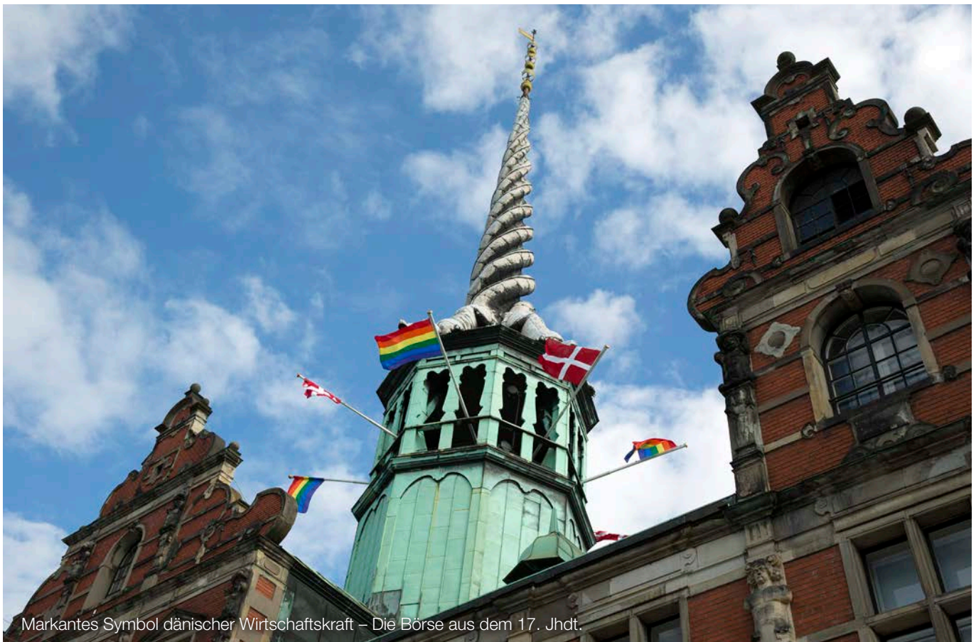
Markantes Symbol dänischer Wirtschaftskraft – Die Börse aus dem 17. Jhdt.

Januar 2023 bis April 2024 anfallenden Kosten für Strom, Gas und Fernwärme auf ein bestimmtes Preisniveau gedeckelt. Die Entlastung ergibt sich dann aus der Differenz zwischen dem vereinbarten Arbeitspreis und einem gesetzlich festgelegten Referenzpreis. Die Entlastung wird auf 70 % bis 80 % des Verbrauchs in 2021 oder des prognostizierten Verbrauchs in 2023 begrenzt. Die resultierende Entlastung wird direkt über eine Verrechnung auf den jeweiligen Strom- und Gasrechnungen gewährt. Für Unternehmen, die durch die Preisbremse oder andere staatliche Beihilfen einen Entlastungsbetrag von mehr als 2 Mio. € erhalten, wird dieser Differenzbetrag auf bestimmte Beträge gedeckelt. Die Preisbremsen für Fernwärme orientieren sich an den Bestimmungen der Gaspreisbremse.