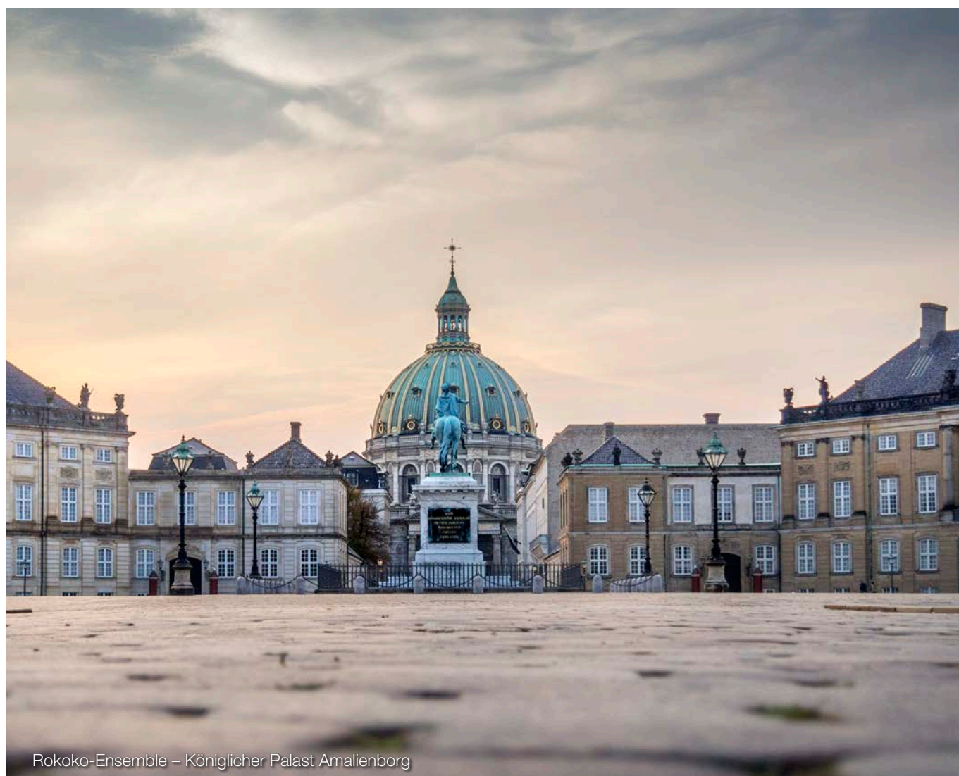
Rokoko-Ensemble – Königlicher Palast Amalienborg

Für die erhaltene Freistellungsbescheinigung besteht eine gesetzliche Aufbewahrungspflicht von sechs Jahren. Es ist nicht ausreichend, wenn der Leistungserbringer auf das Vorhandensein einer solchen Bescheinigung lediglich hinweist (z.B. bei späterer Rechnungsstellung).