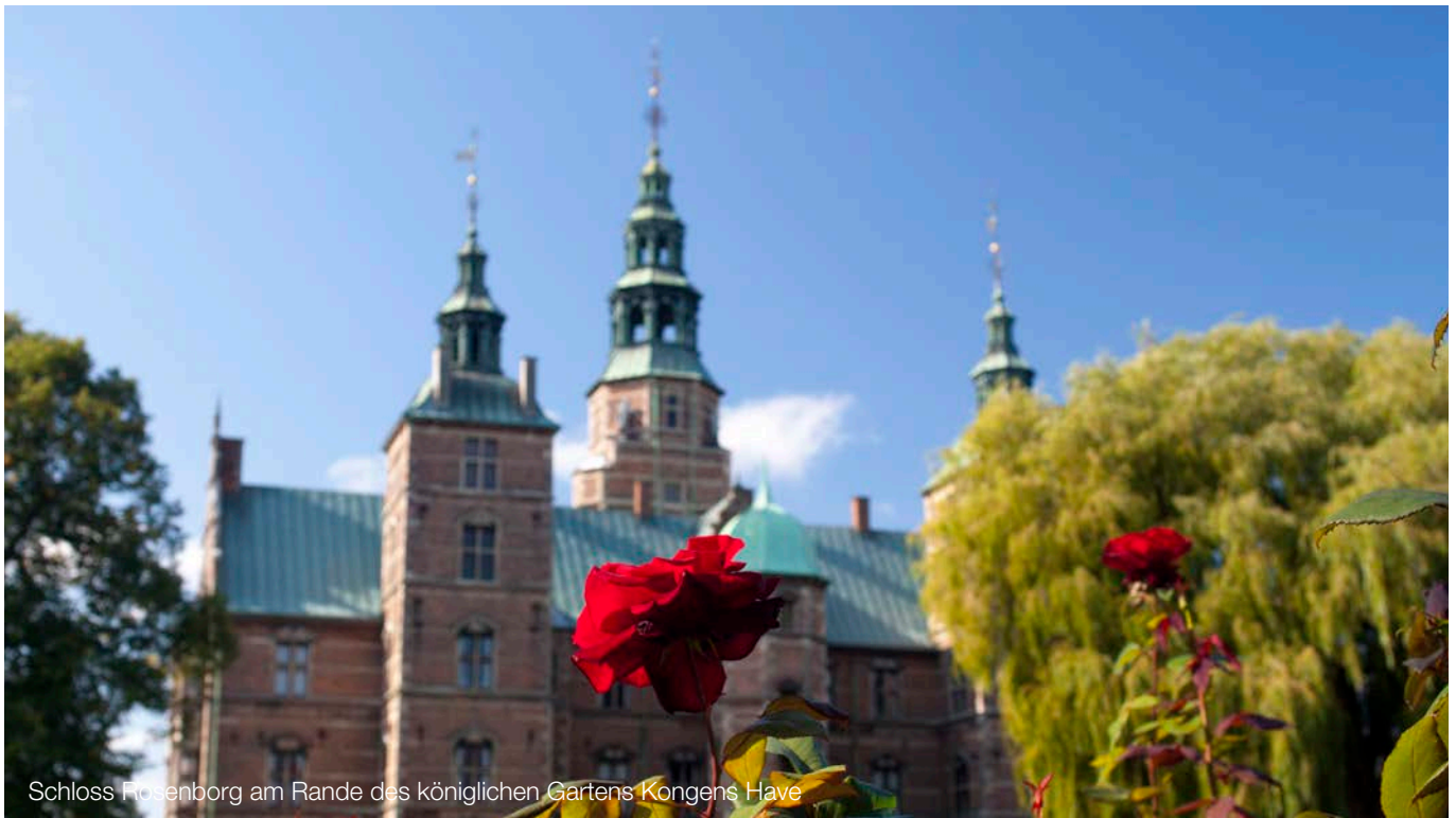
Schloss Rosenborg am Rande des königlichen Gartens Kongens Have

und mithin ein Verdienstausschlag, der zu entschädigen ist, bejaht wurde. Die Entscheidungen sind teilweise rechtskräftig. In einigen Fällen ist aber Berufung eingelegt worden. Es bleibt abzuwarten, ob die Berufungsinstanz die vorstehenden Entscheidungen bestätigt.