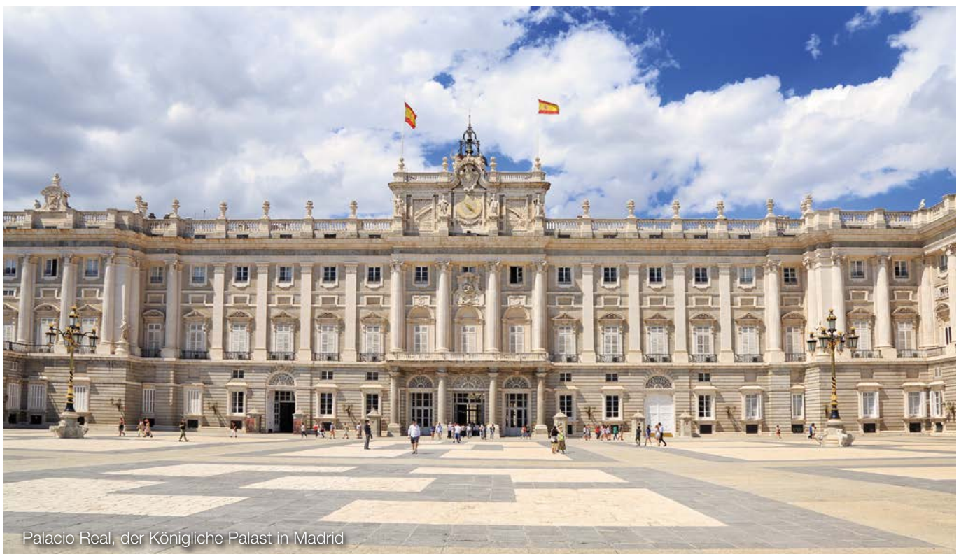
Palacio Real, der Königliche Palast in Madrid

Hinweis: Von der Zufallsgewinnabschöpfung nicht betroffen sind nach den jeweiligen Festvergütungen des