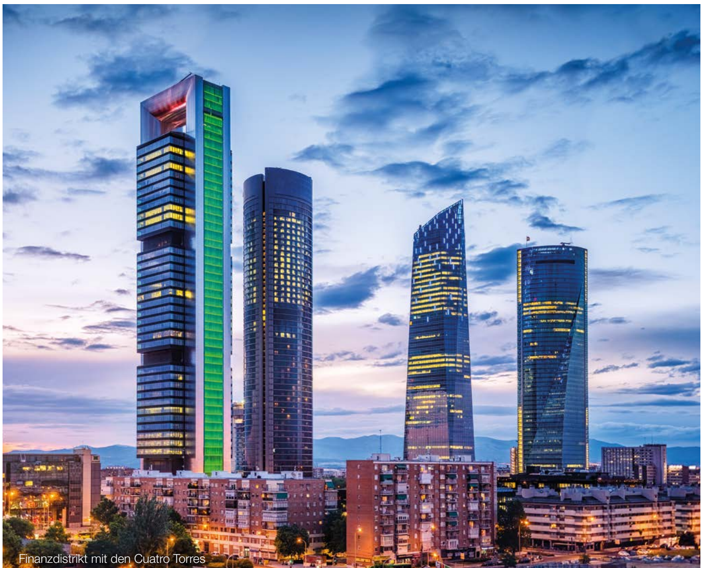
Finanzdistrikt mit den Cuatro Torres

Hinweis: Zu denken ist hier an die weitverbreiteten „Stempel“- oder „Klebe“-Karten, die beispielsweise von