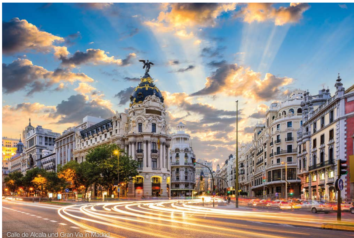
Calle de Alcalá und Gran Vía in Madrid

Bei vermögensverwaltenden Personengesellschaften (z.B. Vermietungs-GbR) führt der Betrieb von PV-Anlagen, die die begünstigten Anlagengrößen nicht überschreiten, nicht zu einer gewerblichen Infektion der Vermietungseinkünfte. Damit können auch vermögensverwaltende Personengesellschaften künftig auf ihren Mietobjekten PV-Anlagen von bis zu 15 kWp je Wohn- und Gewerbeinheit (max. 100 kWp) installieren und ihre Mieter mit selbst produziertem Strom versorgen, ohne steuerliche Nachteile befürchten zu müssen.