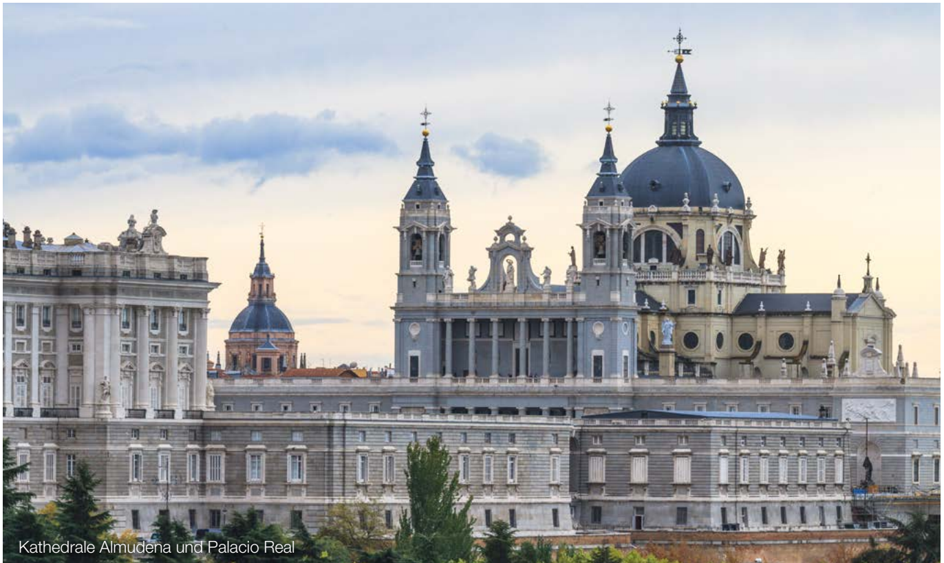
Kathedrale Almudena und Palacio Real

Dabei ist zu beachten, dass sowohl das Testament als auch die Vollmacht handschriftlich verfasst, mit einem Datum versehen und unterschrieben sein müssen. Dass eine Vollmacht über den Tod hinaus geht, ist unabdingbar.