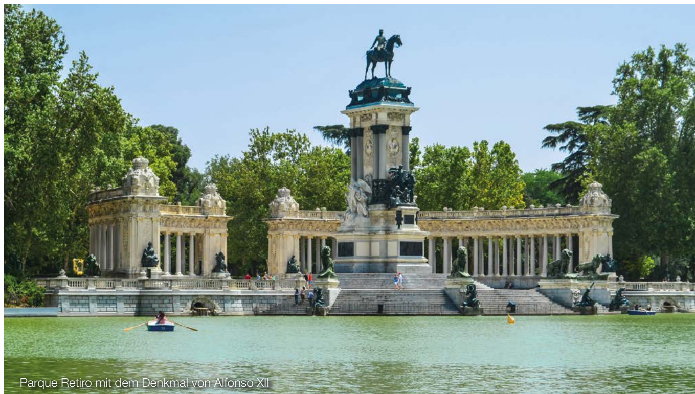
Parque Retiro mit dem Denkmal von Alfonso XII

EEG geförderte Erzeugungsanlagen sowie Erzeugungsanlagen, die innerhalb eines Monats den Strom ganz oder überwiegend auf der Basis von leichtem Heizöl, Steinkohle, Erdgas und weiteren Gasen erzeugen (§ 14 Abs. 3 Nr. 1 und 2 StromPBG).