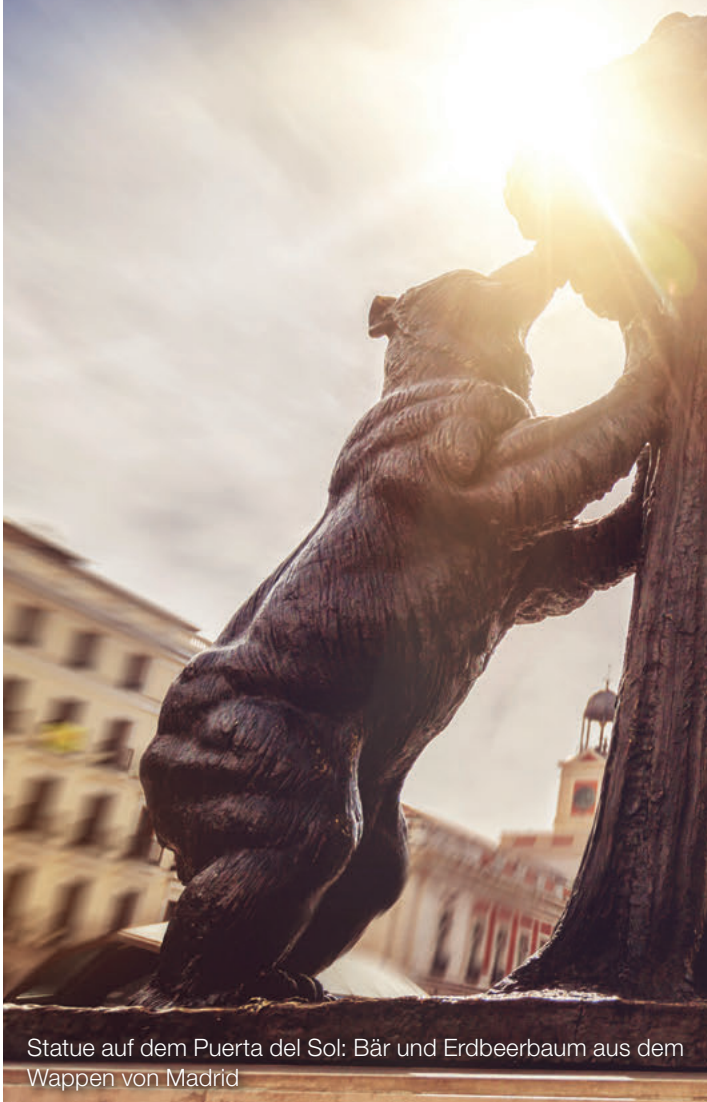
Statue auf dem Puerta del Sol: Bär und Erdbeerbaum aus dem Wappen von Madrid

Titelfoto: Diego-Velazquéz-Denkmal vor dem Prado