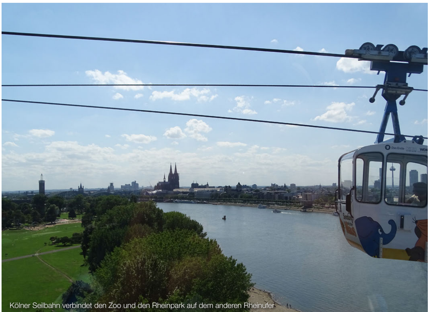
Kölner Seilbahn verbindet den Zoo und den Rheinpark auf dem anderen Rheinufer

Mit der Nachhaltigkeitsberichterstattung sind für mittelständische Unternehmen nicht nur Aufwendungen infolge der Ausweitung der Reportingpflichten verbunden, sondern auch bedeutsame Chancen. Diese bestehen darin, dass soziale und ökologische Aspekte bei der Entscheidungsfindung von Stakeholdern (Kapitalgebern, Mitarbeitenden, Kunden) zunehmend Berücksichtigung finden. Insoweit trägt Nachhaltigkeitsberichterstattung zum Erhalt der Wettbewerbsfähigkeit und der langfristigen Sicherung des Geschäftsmodells bei. Was das im Einzelnen bedeutet, wird Gegenstand des Teils II dieser Beitragsreihe sein. Für Teil III ist ein Erfahrungsbericht vorgesehen, der auf einem bereits für ein KMU erstellten Nachhaltigkeitsbericht fußt.