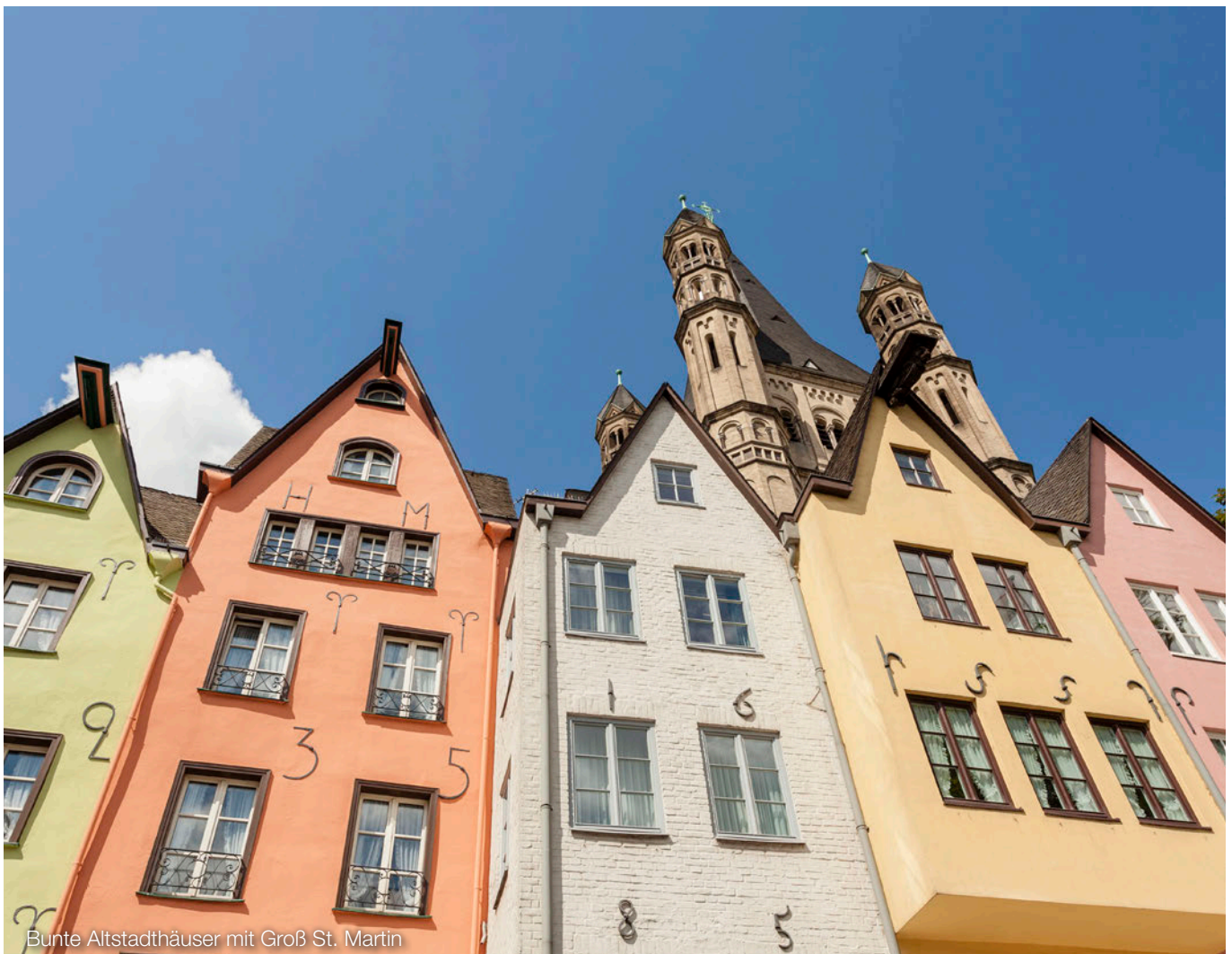
Bunte Altstadt Häuser mit Groß St. Martin

Aufgrund des Stichtagsprinzips sind die bilanziellen Konsequenzen demnach grundsätzlich erst in der Bilanz und GuV von Jahresabschlüssen zu berücksichtigen, die nach dem 23.2.2022 enden. Lediglich in den Fällen, in denen aufgrund der Auswirkungen des Krieges die Annahme der Fortführung der Unternehmenstätigkeit nicht mehr aufrechterhalten werden kann, gilt etwas anderes. Ein Hinweis darauf könnte die massive Verschlechterung der Vermögens-, Finanz- und Ertragslage nach dem Abschlussstichtag sein.