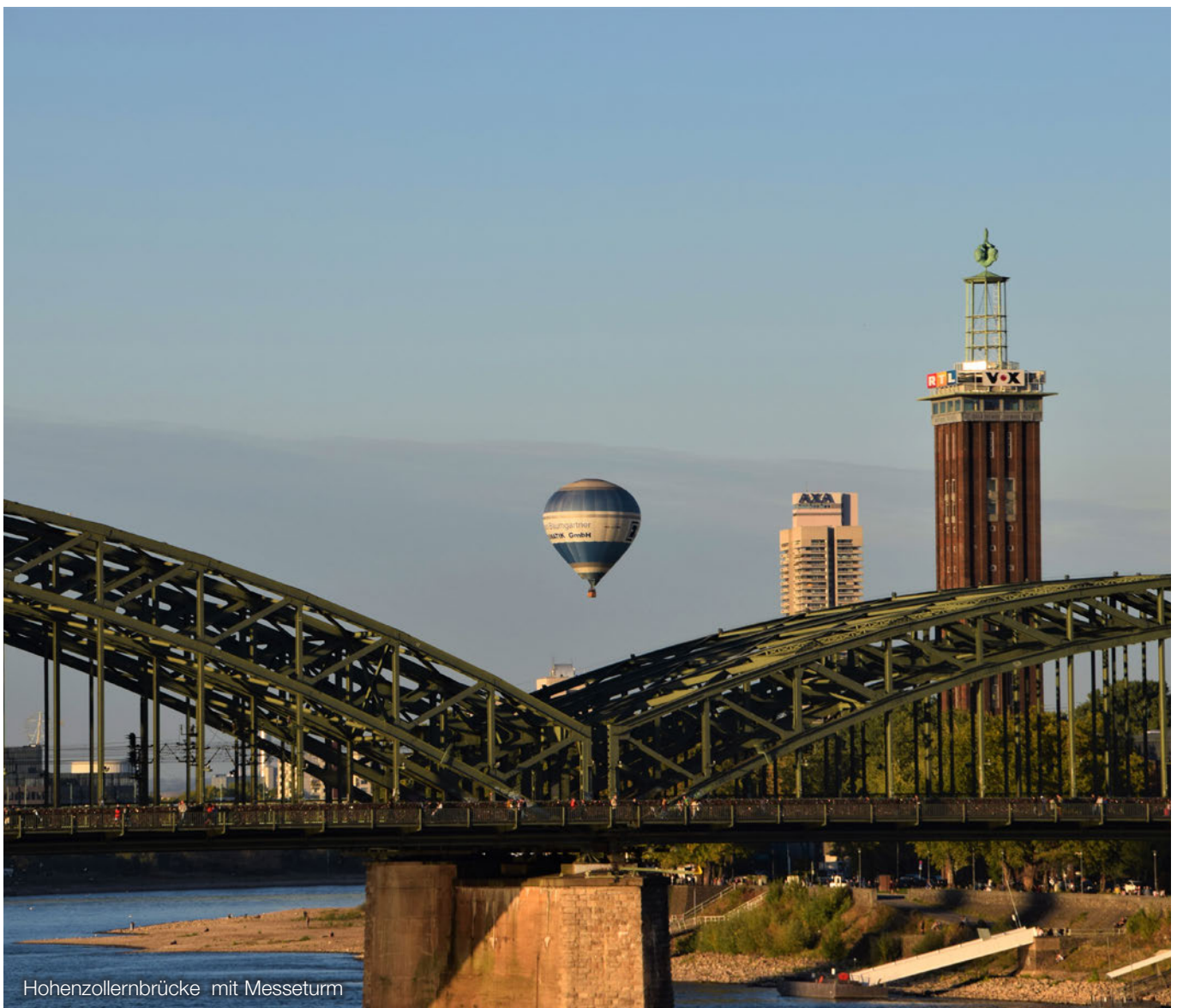
Hohenzollernbrücke mit Messeturm

Grundsätzlich kann sich aufgrund ähnlich gelagerter Inhalte eine Berichterstattungspflicht sowohl im Anhang als auch im Lagebericht ergeben. Um Wiederholungen zu vermeiden und die Transparenz zukunftsbezogener Informationen zu erhöhen, können die Auswirkungen zentral dargestellt werden. Das IDW stellt in seinem Fachlichen Hinweis klar, dass es zulässig ist, im Nachtragsbericht auf die Darstellungen im Lagebericht zu verweisen, falls ansonsten identische Angaben an beiden Stellen aufzunehmen wären. Voraussetzung ist, dass die Verweise im Nachtragsbericht auf den Lagebericht bzw. im Lagebe-