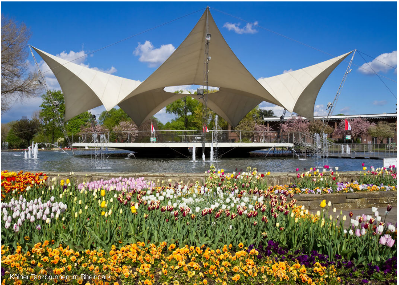
Kölner Tanzbrunnen im Rheinpark

gleichbarkeit von Unternehmen und deren Berichten zum jetzigen Zeitpunkt oft nicht möglich. Des Weiteren sind die Angaben nicht Teil einer Abschlussprüfung. Aufbauend auf der bisherigen Richtlinie wird deshalb momentan die nichtfinanzielle Berichterstattung weiterentwickelt und unter dem neuen Begriff Nachhaltigkeitsberichterstattung bzw. CSR-Richtlinie (engl. Corporate Sustainability Reporting Directive) von der EU-Kommission vorgeschlagen.